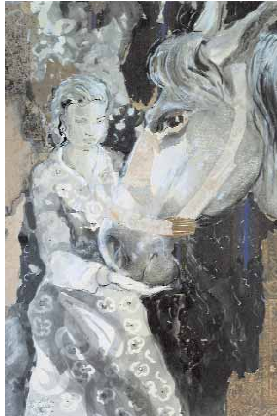
Met het paard van de groenteman